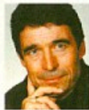
Af Anders Fogh Rasmussen Venstres formand.

Den 5. juni 1999 fylder den danske grundlov 150 år. Grundloven er slet ikke så ringe. Der er bestemt grund til at fejre dens jubiläum. Og jeg tror, at den seneste grundlov fra 1953 kan fungere som ramme om det danske folkestyre i mange år endnu. Fra tid til anden bliver der rejst ønske om en ændring af grundloven. Og selvfølgelig må grundloven med mellemrum ændres, så den bliver tilpasset udviklingen i samfundet. Der skal imidlertid være bred tilslutning i befolkningen til noget så vigtigt som en ændring af grundloven. Derfor skal en sådan ændring forberedes grundigt.